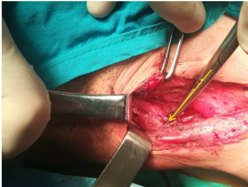
Şekil 2 : Kitlenin intraoperatif görüntüsü (sarı ok)

Önce kitleden usg eşliğinde kalın iğne biyopsisi yapıldı. Patoloji raporunda gönderilen materyalin kas ve epitel dokudan ibaret olduğu, lenfoid doku içermediği belirtildi. Bunun üzerine tarafımızca yapılan boyun eksplorasyonunda juguler ven komşuluğunda yer alan, juguler vene bası yapan kitle görüldü (Şekil 2).