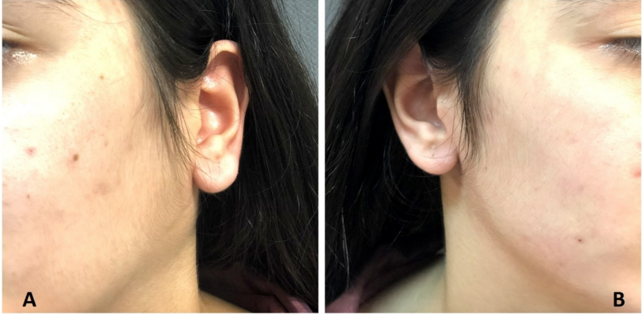
Şekil 1 : Sol parotis kuyruk bölümünde daha belirgin şişlik (A), sağ parotis normal görünümde (B)