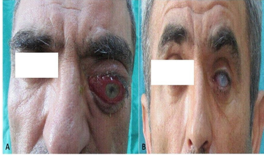
Şekil 1 : Hastanın; A. Preoperatif görünümü B. Postoperatif görünümü

Herhangi bir sistemik hastalığı bulunmayan hastanın 20 yıl önce geçirilmiş sinüs cerrahisi öyküsü mevcuttu. Hastanın yapılan muayenesinde sol göz ileri derecede proptotik izlendi. Kornea hiperemik ve ödemli izlendi. Ekspozüre nedeniyle ağır keratopati mevcuttu. Sol gözde hareket kısıtlılığı görüldü (Şekil 1).