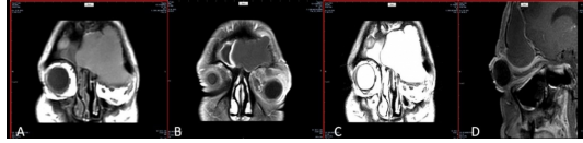
Şekil 3 : A.Koronal kesit T1 ağırlıklı MR frontal sinüste ekspansif mukosel, B. Koronal kesit T1 ağırlıklı kontrastlı MR inferiyorda deprese orbita , C. Koronal Kesit T2 ağırlıklı MR, D. Sagittal kesit T1 ağırlıklı MR optik sinir üzerine bası yapan mukosel

Hastanın orbita MRG'de sol frontal sinüsten kaynaklanan frontal sinüste ekspansil genişlemeye neden olan frontal sinüs duvarlarında özellikle posteriorda belirgin rezorpsiyon oluşturan uniloküle lobule konturlu mukosel ile uyumlu kistik lezyon izlendi. Lezyonun intravenöz kontrast madde enjeksiyonu sonrasında çevresel minimal kontrast tuttuğu izlendi. Lezyonun ekspansiyonuna bağlı sol orbitaya posteriyo-süperiyordan belirgin ekstrakranal bası ve sol gözde propitoz izlendi (Şekil 3).