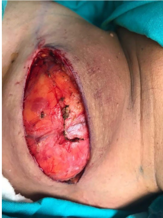
Şekil 3 : Hastanın intraoperatif kitlesinin görünümü (Sağ supraklaviküler bölge)