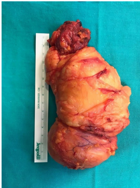
Şekil 4 : Kitlenin eksize edilmiş görünümü

İncelenen Patoloji Spesmeni 13x8x4,5cm ölçülerinde sarı-kahverengi etrafı çoğu alanda kapsüle yağ bağ dokudan oluşan materyaldir. Kesiti homojen sarı renkli olup yer yer damar yapıları içermektedir. Ayrıca kutu içerisinde 5,5x4x2cm ölçülerinde gri-kahverengi fibroadipöz doku izlenmiştir. İntramusküler Lipom olarak patoloji