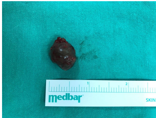
Şekil 2 : Eksize edildikten sonra kistik lezyon